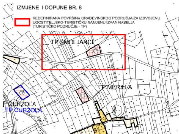
iD PPT/O (Prijedlog)

Redefinirane su površine građevinskih područja za izdvojene ugostiteljsko-turističke namjene (turistička područja - TP) izvan naselja za zone Rapnonji, Klarići i Smoljanci uz uvjet da se površina pojedinačne zone nije mijenjala . Izmijenjen je i smještajni kapacitet za te zone uključujući zonu Merilla, na način da je zadržan ukupni smještajni kapacitet određen dosad važećim Planom. Navedena turistička područja su redefinirana iz razloga lakšeg rješavanja imovinsko-pravnih odnosa, problematike infrastrukturnih sustava, te iskazanih zahtjeva korisnika prostora u cilju realizacije predmetnih zona i sveukupnog gospodarskog razvoja na području Općine Svetvinčenat.