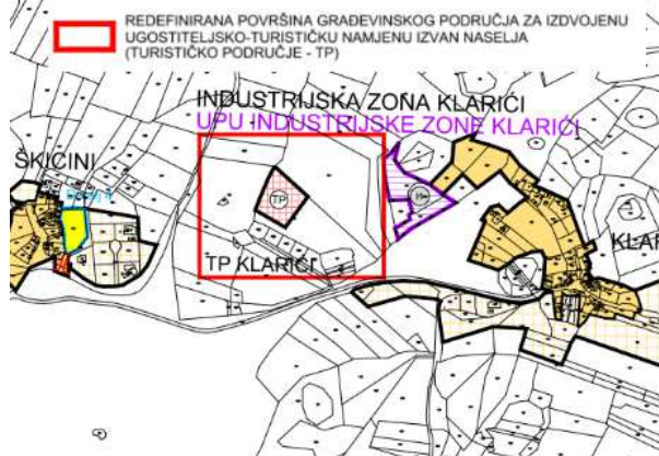
iD PPUO (Prijedlog)