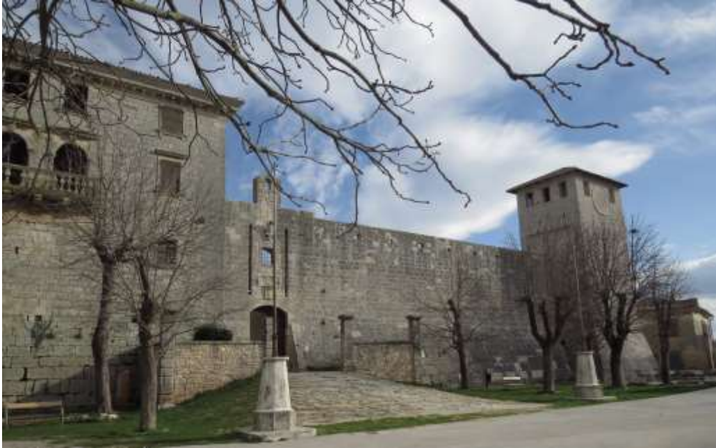
Slika 2.: Unutrašnjost kaštela Morosini Grimani, pogled na palaču kaštela i planirani izložbeni prostor