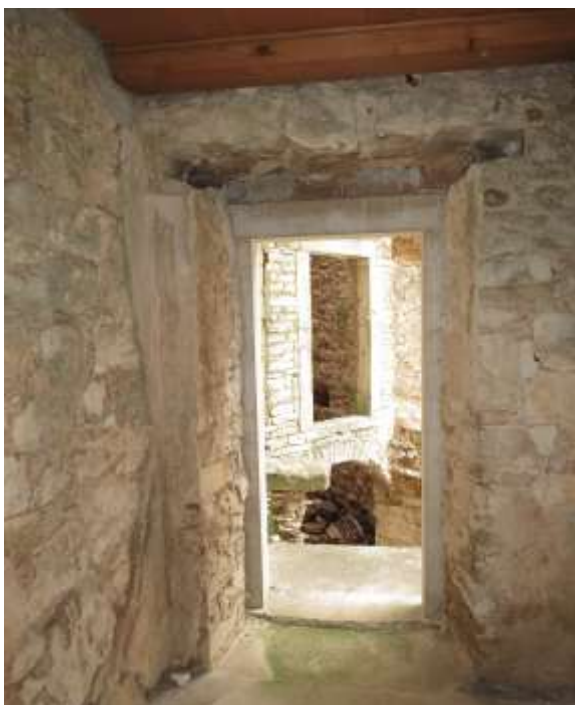
Slika 6.: Ulaz u izložbeni prostor